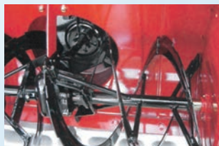
除雪機オーガの雪付着防止